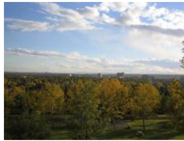
(b) Pan ma signo.